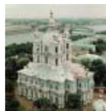
Chiesa della Resurrezione

■ Dentro la Fortezza gli ospiti saranno intrattenuti da canti tipici, cori tradizionali e da musiche magnifiche in un'atmosfera magica ■ Rientro in hotel, per un po' di relax e cambio d'abito. Trasferimento e cena al noto ristorante "Na Zdorovie" ■ rientro in hotel e pernottamento