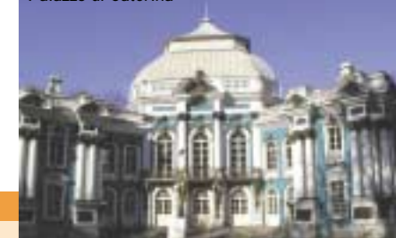
Palazzo di Caterina

■ dopo lo spettacolo, trasferimento al Ristorante "Kolchida" per la cena, un "late dinner" (in base all'orario della rappresentazione, la cena potrebbe avvenire o prima o dopo lo spettacolo) ■ Rientro in hotel, pernottamento