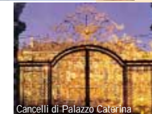
Cancelli di Palazzo Caterina