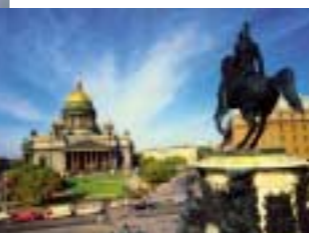
Cattedrale San Isacco