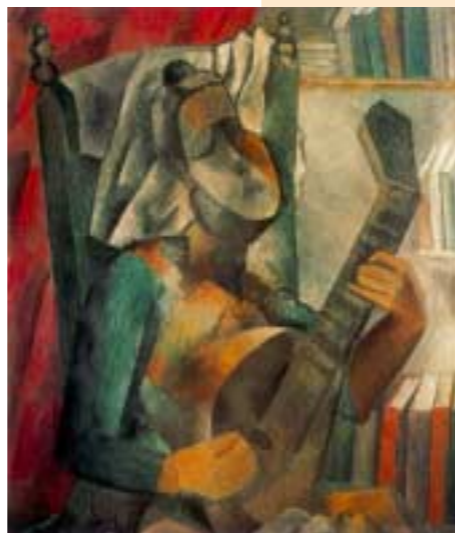
"Donna con mandolino" di Pablo Picasso, 1909

L'Hermitage è uno dei più grandi musei al mondo, è stato calcolato che se si dedica un solo minuto per ammirare ogni opera esposta, occorre passare ben 11 anni all'interno, infatti racchiude 2.700.000 opere tra quadri, monete, sculture, pezzi d'arredamento e oggetti dell'età della pietra e del bronzo. Collezioni scite, bizantine, islamiche, persiane, greche, turche, romane, indiane, cinesi, in un rutilante panorama delle civiltà custodite in 50 mila metri quadri di esposizione per 24 km di percorso totale di visita