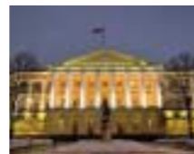
Sede del governo amministrativo di San Pietroburgo