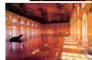
Sala del trono