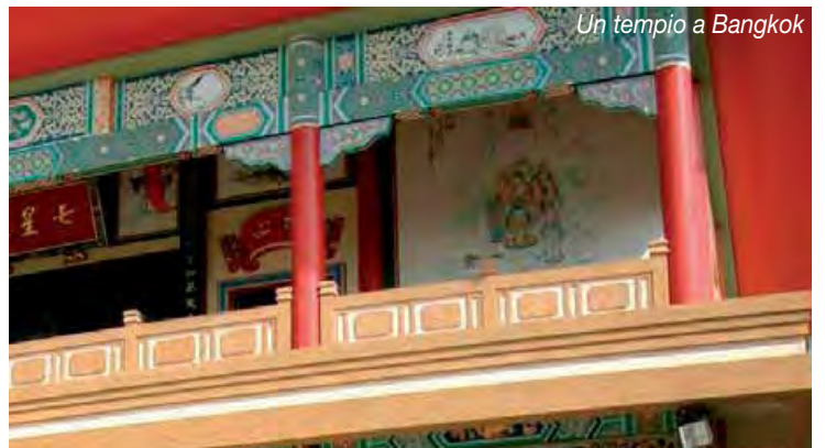
Un tempio a Bangkok