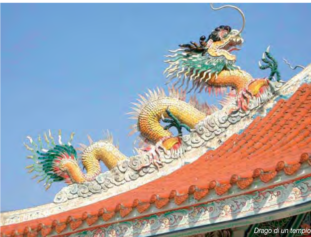
Drago di un tempio