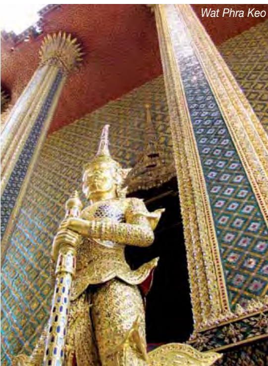
Wat Phra Keo