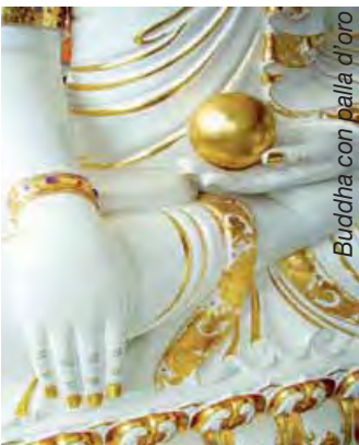
Buddha con palla d'oro