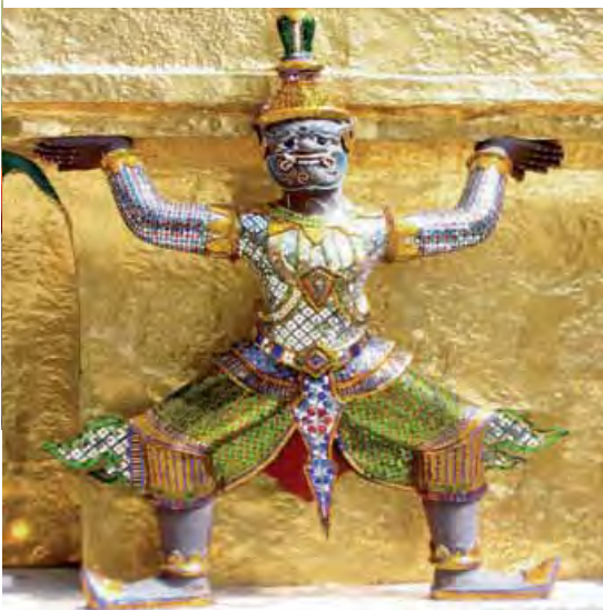
Decorì in oro a Wat Phra Keo