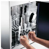
Knife storage unit removable